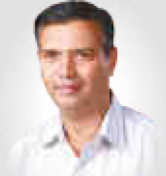
मा. सी.ए. नागनाथ अं. बसुदे स्वीकृत तज्ञ संचालक